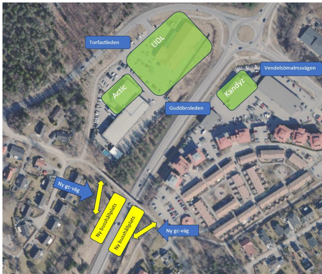
Figur 4 - Trafikverket bekostar och utför nya busshållplatser. Haninge bekostar och utför nya gång- och cykelanslutningar till berörda busshållplatser.