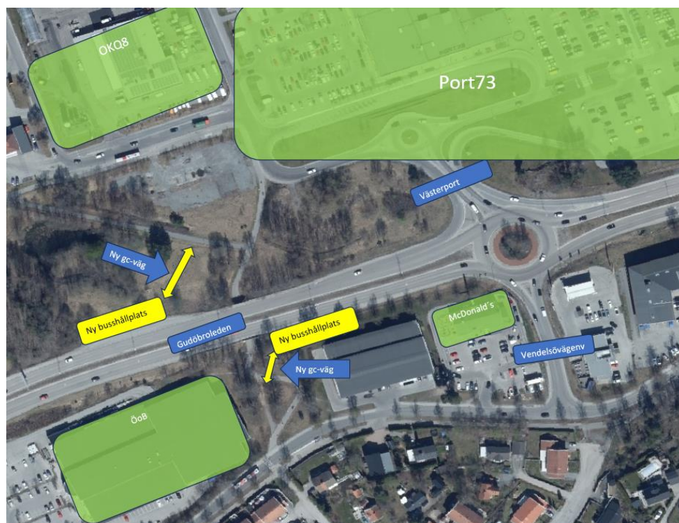
Figur 3 - Nya busshållplatser med anslutande gång- och cykelvägar.