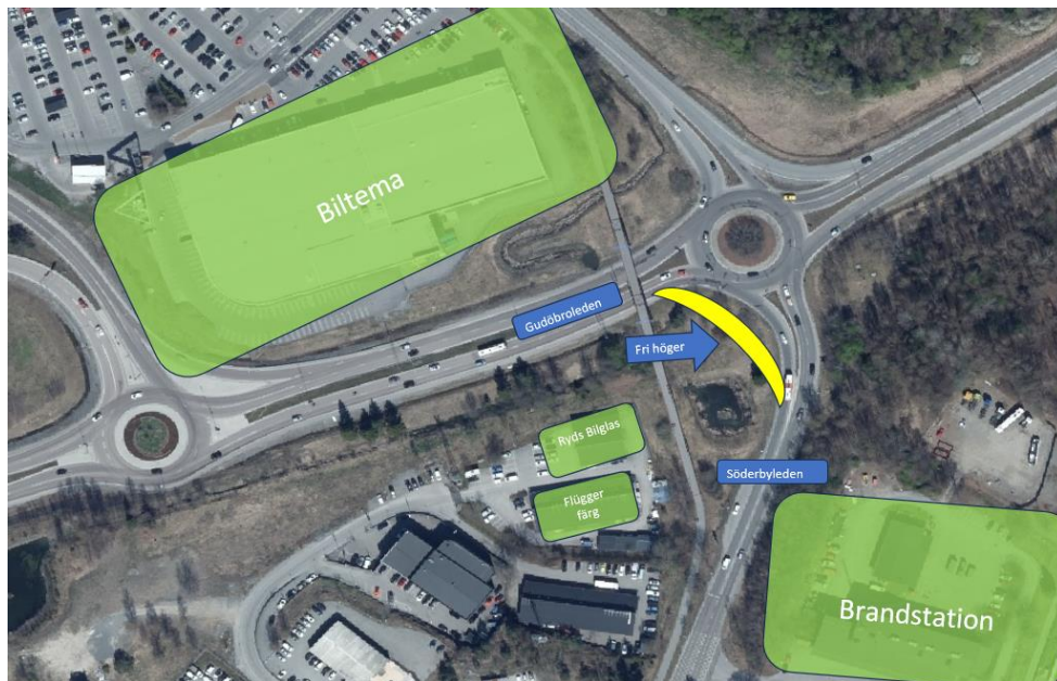
Figur 2 - Fri högersväg, från Gudöbroleden till Söderbyleden.